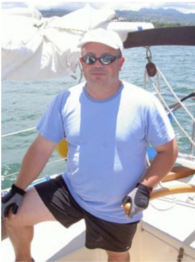
Choć kapitan „Boris” z łezką w oku wspomina pionierskie, solińskie czasy, prawdziwe żeglarstwo to dla niego pływanie po morzach i oceanach.

zając swą życiową pasję. Wyszukiwał już kilka tysięcy żeglarzy, z powodzeniem startuje w wielkich międzynarodowych regatach. Pływa na łodzi typu Tiary