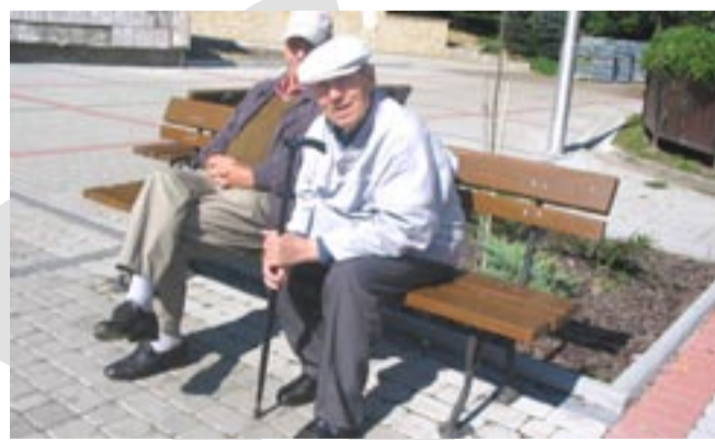
Nie tak dawno podczas sesji wnioskowano o ustawienie ławek w parku, dziś już są. Oby jak najwięcej wniosków kończyło się w taki sposób.