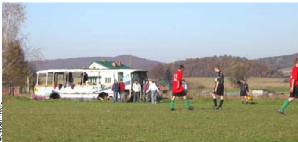
Stary autobus obok stadionu w Kostarowcach jeszcze służy piłkarzom „Pogórze” za szatnię, ale już wkrótce przebiarą się będą w cywilizowanych warunkach.

– Podobno przeciągała się dlatego, że pod wykupionym terenem biegnie wodociąg. Choć o ile nam wiadomo, to znajduje się on poza płytą boiska – mówi sympatyk klubu „Pogórze”.